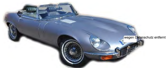
Jaguar E-Type Cabrio

Auftrag vom: 14.08.2021 Auftragsart: Kurzbewertung des Markt- und Wiederbeschaffungswertes Auftraggeber: wegen Datenschutz entfernt Besichtigungsort: wegen Datenschutz entfernt Besichtigungstermin: 14.08.2021 bei Besichtigung anwesend: Herr wegen Datenschutz entfernt SV Becker