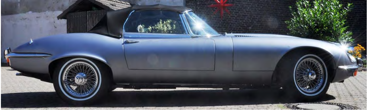
schadhafte Stelle der Folierung: